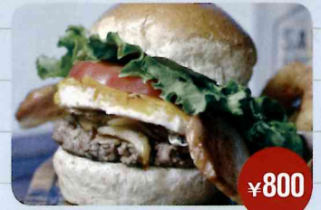
ベーコンエッグバーガー ¥800 奈良 ONO DINER milimili (オーノダイナーミリミリ)

愛知県産知多牛100%のビーフパティが自慢のバーガー。愛知県産の野菜とスモークナーオリジナルBBQソースを豪快にサンド! 知多半島の恵みを感じるハンバーガーをご堪能あれ