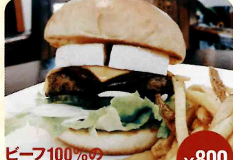
ビーフ100%のWチーズバーガー ¥800

奈良 トルカ なんとケバブがハンバーガーに变身! 外はカリッと、中はふんわりのパンズにケバブを豪快にサンド。トマト専門店のトマトにレタスなど、野菜にもこだわる。秘伝のケバブソースを味わうべし。