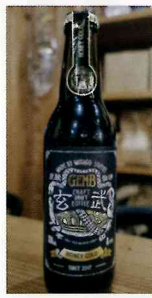
炭酸珈琲玄武 瓶 ¥500

西日本ハンバーガー協会×珈琲焙煎工房 みさご珈琲による、ハンバーガーイベント限定コーヒーが登場! 向井 務オーナー開発の炭酸コーヒー「玄武」ほか、「ハンバーガーの後に飲みたいくなり、飲めばまたハンバーガーが食べたいくなるコーヒー」が飲めるのはココだけ!