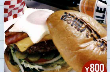
高槻バーガー ¥800 大阪 ティーズスターダイナー

大阪 ジャージー食品株式会社 直径12センチのゴマパンズで、150グラム、ビーフ100%パティをサンド! 銚色玉ねぎなど野菜をふんだんに使うトマトソースと、デミグラスソース、スパイスの効いたマヨネーズの3種で味をまとめる。