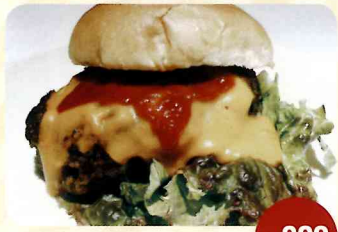
牛タン100% チーズバーガー ¥800

西日本ハンバーガー協会が実際に食べ歩いて厳選し、自信を持って送り出す8店舗の珠玉のハンバーガーがこちら。お客様の投票(各店先着100名様に投票用シールを配布)と特別審査員の審査の合計で、ナンバーワンが決定する!