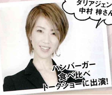
ハンバーガー食べ比べトークショーに出演!